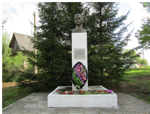
Дом-музей А. Чекалина в селе Песковатское

В Туле о подвиге юного героя напоминает бюст Александра Чекалина, установленный в 1975 г. на улице Бундурина 56 на территории Тульского областного центра образования.