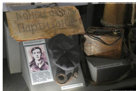
Табличка с груди юного Героя находится сегодня в Центральном музее Вооружённых Сил Российской Федерации в Москве

Только после освобождения Тульской области от фашистских захватчиков, тело Александра Чекалина с воинскими почестями было предано земле в сквере города Лихвин.