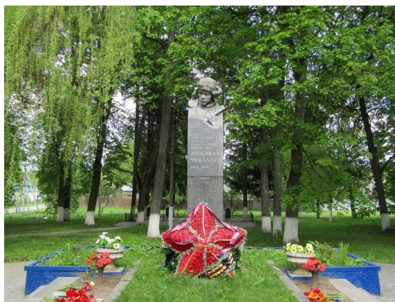
Памятник Александру Чекалину в городе Чекалин (бывший Лихвин)