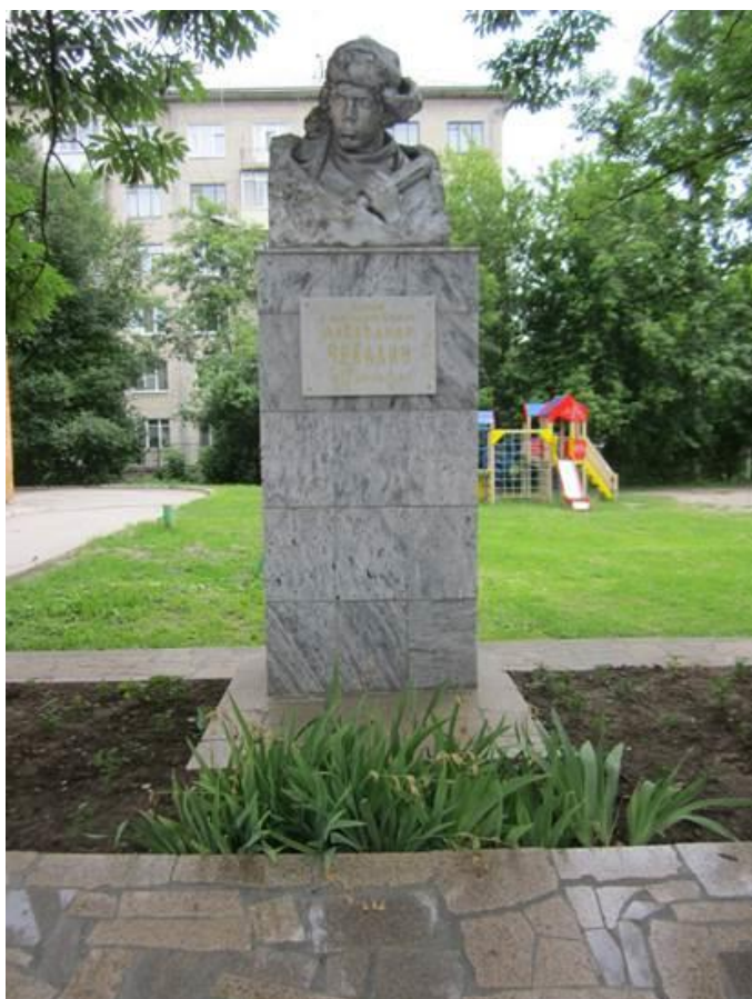
Памятник Александру Чекалину в Туле

В Туле о подвиге юного героя напоминает бюст Александра Чекалина, установленный в 1975 г. на улице Бундурина 56 на территории Тульского областного центра образования.